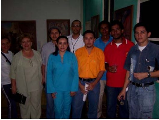
Muestra Itinerante en Valledupar, Cesar