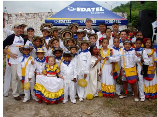
Fundación Niños Vallenatos del Turco Gil

Con el apoyo de EDATEL, la Fundación ha tenido la posibilidad de realizar viajes en los que han representado al país de una manera exitosa, vale la pena citar algunos ejemplos como las visitas que realizaron al presidente de los Estados Unidos en la Casa Blanca y al presidente de Venezuela en Caracas, además de numerosas presentaciones al interior de Colombia.