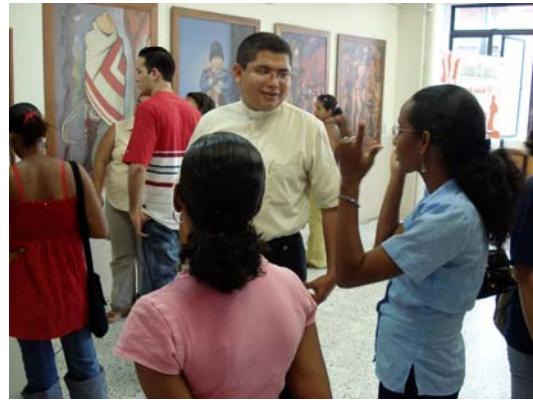
Muestra Itinerante en Puerto Berrío, Antioquia

Posteriormente, el Museo se trasladó al municipio de Andes, Antioquia, entre el 18 de abril y el 6 de junio donde también hubo una activa participación de toda la comunidad frente a esta manifestación cultural.