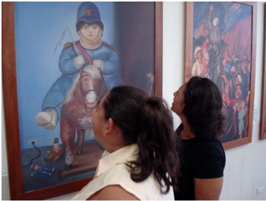
Muestra Itinerante en Puerto Berrío, Antioquia

asistieron cerca de 1.600 personas entre adultos, jóvenes y niños, superando las expectativas iniciales del programa.