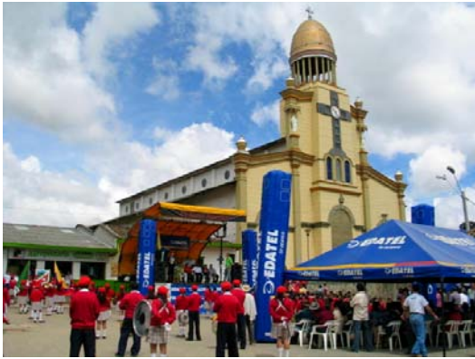
Fiestas del Río Aragón, Santa Rosa de Osos, Antioquia