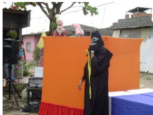
Jornadas de sensibilización con la comunidad. Barrio Mogambito, Montería, Córdoba