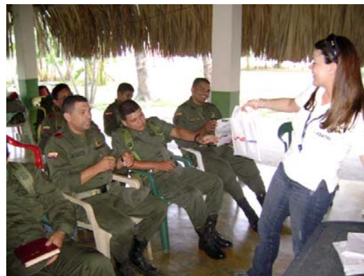
Reunión con la Policía Nacional. Cereté, Córdoba