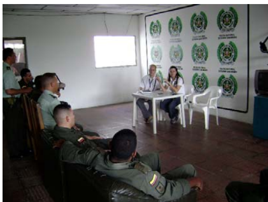
Reunión con la Policía Nacional. San Antero, Córdoba

La respuesta que se ha tenido ante estas convocatorias ha sobrepasado las expectativas, pues con la vinculación de la comunidad y el apoyo de la Policía Nacional (con quienes se trabaja mancomunadamente), se ha permitido la captura de varios delincuentes dedicados al hurto de cable en estas zonas.