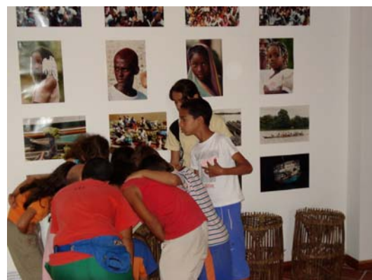
Muestra Itinerante en Andes, Antioquia

Simultáneo a la Exposición en Andes, se llevaba a cabo otra muestra en la ciudad de Valledupar en el departamento del Cesar, en donde se realizó por primera vez un aula taller con docentes de la localidad. En esta ocasión hubo un gran compromiso de la Alcaldía, la Secretaría de Educación y la Casa de la Cultura para que el evento se llevara a cabo y tuviera el éxito que al final alcanzó.