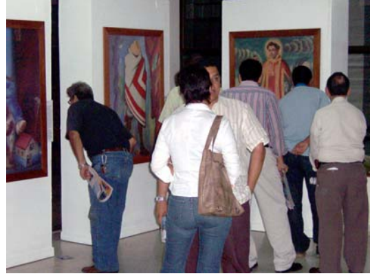
Muestra Itinerante en Valledupar, Cesar

Por último, en el 2007, EDATEL y el Museo de Antioquia visitaron el municipio de El Peñol en Antioquia, entre el 12 de junio y el 12 de julio, donde se tuvo una gran respuesta de las diferentes instituciones educativas, lo que permitió la vinculación de los estudiantes del municipio.