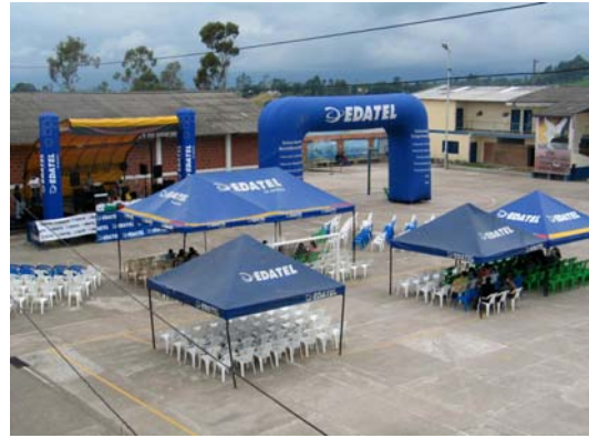
Fiestas del Atardecer, Santa Rosa de Osos, Antioquia

Adicionalmente, la Compañía viene patrocinando desde el año 2006, la Fundación “Niños Vallenatos del Turco Gil”, una entidad de la ciudad de Valledupar que reúne aproximadamente 40 niños para formarlos y educarlos en el ámbito musical, conformando de esta manera una de las agrupaciones más reconocidas y queridas de este tipo en el país.