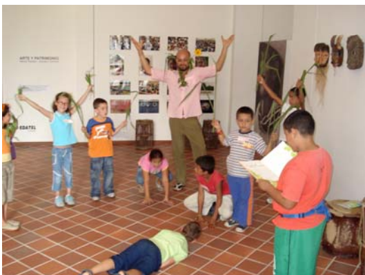
Muestra Itinerante en Andes, Antioquia

Posteriormente, el Museo se trasladó al municipio de Andes, Antioquia, entre el 18 de abril y el 6 de junio donde también hubo una activa participación de toda la comunidad frente a esta manifestación cultural.