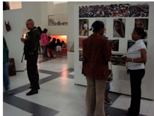
Muestra Itinerante en El Peñol, Antioquia

La estrategia, que tuvo un valor de $40.000.000 se desarrolló con el objetivo de “trasladar” obras, proyectos y exposiciones del Museo de Antioquia a localidades con poco acceso a la cultura y el entretenimiento, muestra de ello, son los resultados del estudio que EDATEL realizó para conocer los comportamientos, sueños y aspiraciones de las personas en los municipios, donde se puede observar claramente que estas poblaciones cuentan con muy pocas opciones de diversión, diferentes a las que normalmente realizaría una persona en su hogar; de ahí el claro compromiso por ofrecer diferentes alternativas de esparcimiento para los habitantes.