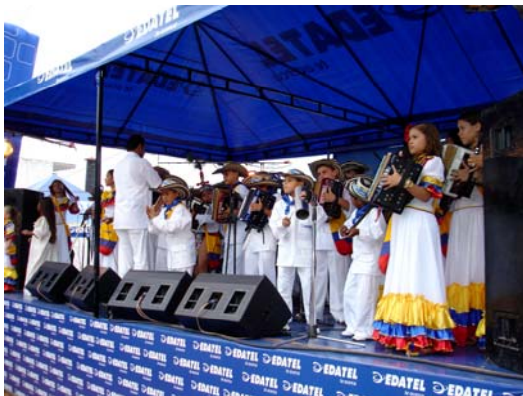
Fundación Niños Vallenatos del Turco Gil

Adicionalmente, la Compañía viene patrocinando desde el año 2006, la Fundación “Niños Vallenatos del Turco Gil”, una entidad de la ciudad de Valledupar que reúne aproximadamente 40 niños para formarlos y educarlos en el ámbito musical, conformando de esta manera una de las agrupaciones más reconocidas y queridas de este tipo en el país.