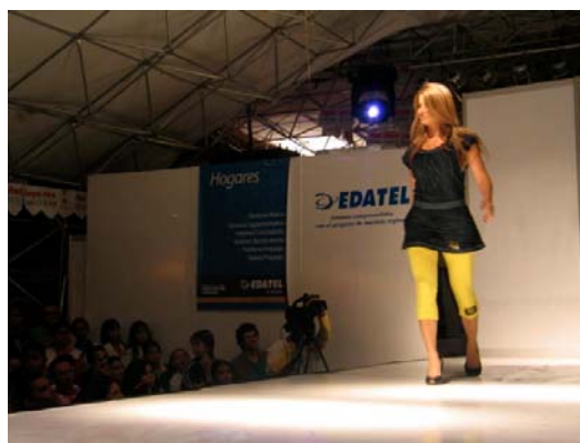
Feria de la Confección y la Cultura, Donmatías, Antioquia.