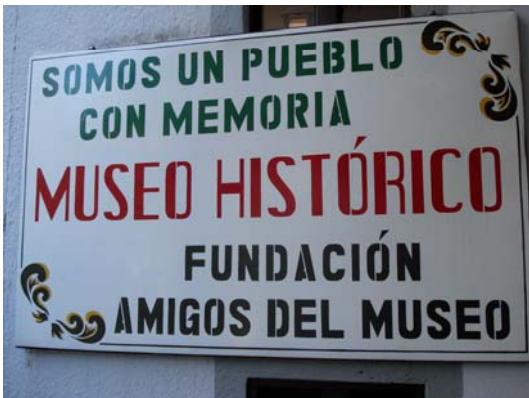
Muestra Itinerante en El Peñol, Antioquia

Por último, en el 2007, EDATEL y el Museo de Antioquia visitaron el municipio de El Peñol en Antioquia, entre el 12 de junio y el 12 de julio, donde se tuvo una gran respuesta de las diferentes instituciones educativas, lo que permitió la vinculación de los estudiantes del municipio.